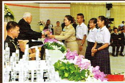
นำนักเรียนรับทุนการศึกษา มูลนิธิเปรม ติณสูลานนท์ โครงการคณิตศาสตร์ ระดับชั้นมัธยมศึกษาตอนปลาย