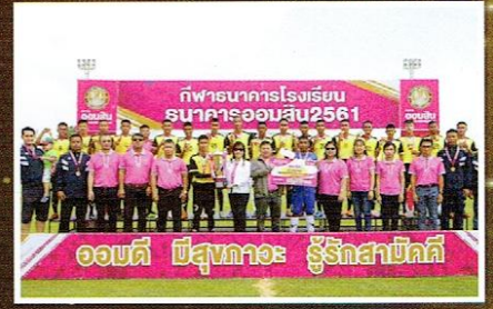
นักเรียนได้รับรางวัล การแข่งขันกีฬาระดับภูมิภาค