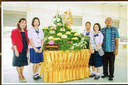
งานแกะสลักของนักเรียนที่เข้าแข่งขัน ได้รับรางวัลชนะเลิศเหรียญทองระดับชาติ