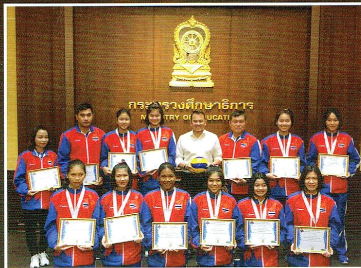
รางวัลชนะเลิศเหรียญทอง จากการแข่งขัน วอลเลย์บอลรายการ Australian Junior Volleyball- Championships 2019 รุ่นอายุไม่เกิน 19 ปี ณ ประเทศออสเตรเลีย